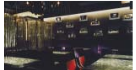
銀座レストラン「Ag」施工例